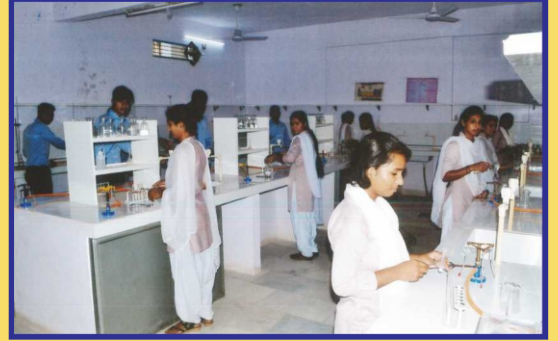
महाविद्यालय रसायन विज्ञान प्रयोगशाला