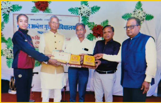
महाविद्यालय प्रतिभा पुरस्कार वितरण