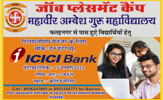
महाविद्यालय में जॉब फ्लेसमेंट केम्प