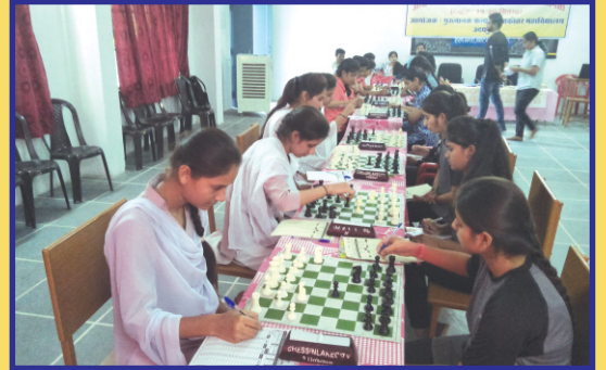
महाविद्यालय शतरंज प्रतियोगिता