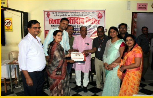
रक्तदाताओं को प्रमाण-पत्र वितरण