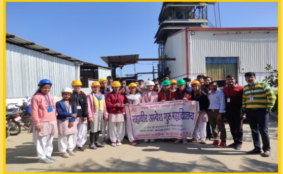
विज्ञान संकाय का औद्योगिक भ्रमण