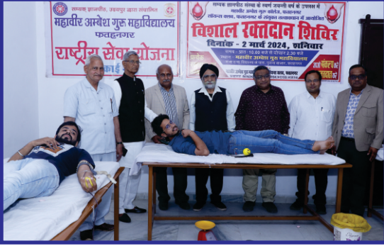
रक्तदाताओं को प्रमाण-पत्र वितरण