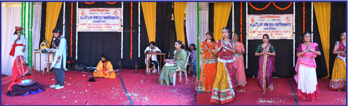
महाविद्यालय पारितोषिक एवं प्रतिभा सम्मान समारोह 2024 में प्रस्तुतियाँ