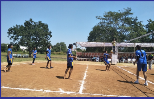
महाविद्यालय वॉलीबाल प्रतियोगिता