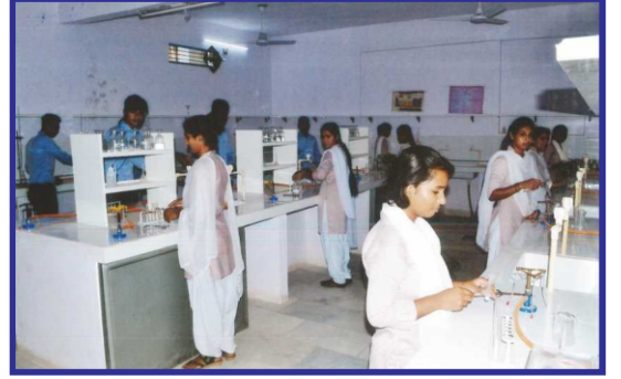
महाविद्यालय रसायन विज्ञान प्रयोगशाला