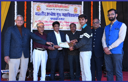
महाविद्यालय प्रतिभा पुरस्कार वितरण