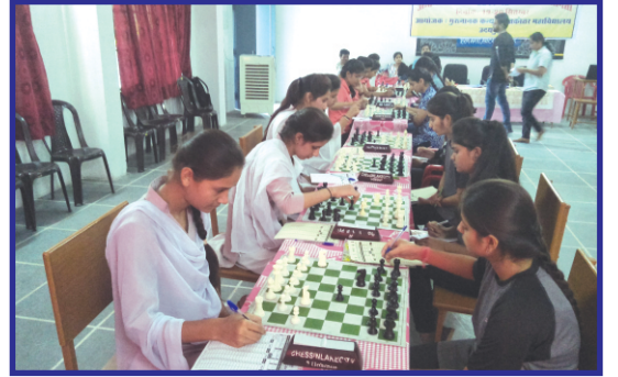
महाविद्यालय शतरंज प्रतियोगिता