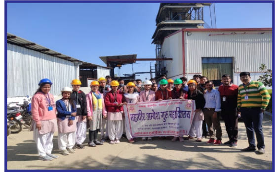
विज्ञान संकाय का औद्योगिक भ्रमण